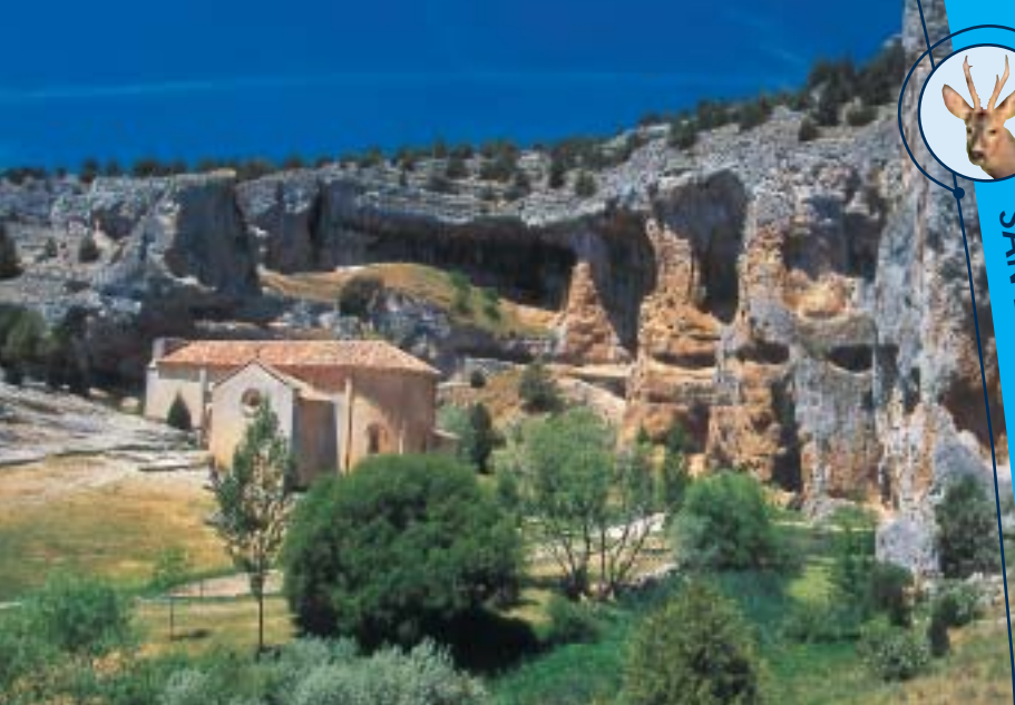
Cañón del Río Lobo. Ermita de San Bartolomé.

tante reserva de buitre leonado y otras aves rapaces (alimoche, águila real, halcón peregrino, etc.). En el corazón del cañón se encuentra la ermita de San Bartolomé, resto hermoso y único del convento de templarios que aquí tuvo asiento. Ermita de gran sencillez, bello ejemplar de románico tardío. Cuenta con un Centro de Interpretación que ofrece al visitante una completa información sobre el Parque.