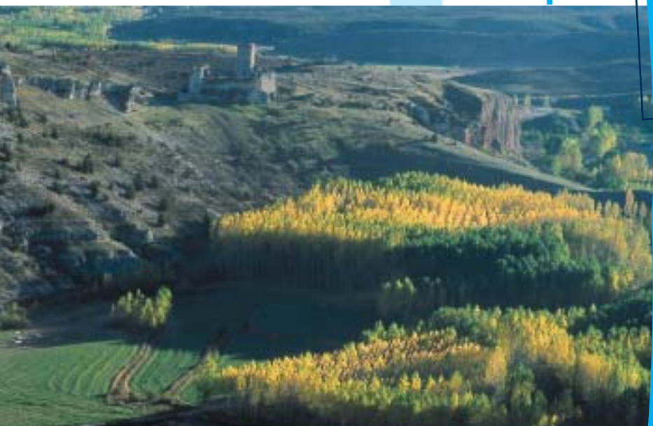
Castillo de Uceró visto desde La Galiana

Una vez que llega al Cañón del Río Lobos , vadea el río y sigue aguas abajo por un sendero de traza muy marcada por el frecuente paso de los visitantes del Parque Natural. Dos kilómetros y medio de sendero separan el arroyo de Valderrueda de la ermita de San Bartolomé . Pasada la ermita, el sendero se convierte en un ancho camino muy transitado por los turistas durante los fines de semana. Continuando por éste, en unos tres kilómetros, sale directamente a la carretera de Uceró en el punto del río Lobos , al inicio del puerto de La Galiana.