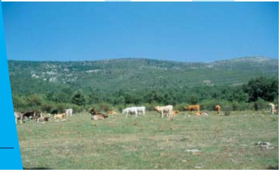
Dehesa de Ucero

Sale del pueblo y enlaza directamente con la pista que, al cabo de unos cuatro kilómetros, corta con la Cañada Real Soriana Occidental y, un poco más adelante, con el camino que accede a Barcebalejo. Tras otros cuatro kilómetros más de pista, entra en la villa de El Burgo de Osma , cortando con la carretera de Valladolid, a la altura del desvío de la carretera local que conduce al pueblo de La Rasa.