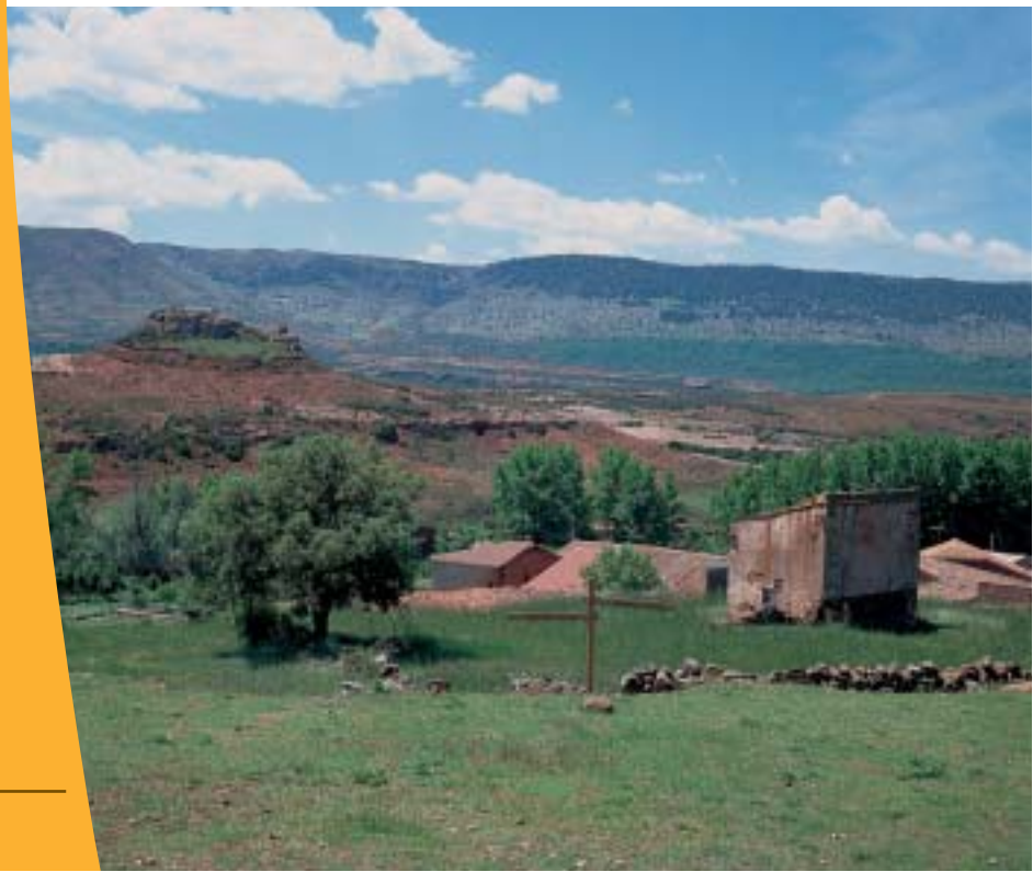
Vista de Sierra Pela desde Valvedizo.

Atraviesa el despoblado por camino y continúa descendiendo de forma paralela al río Tiermes para, ochocientos metros más abajo, cruzarlo por un vado junto a un bosque de álamos temblones y continuar por otro camino girando a la derecha. Un corto tramo lleva hasta un grupo de majadas, donde toma una trocha que sale hacia la derecha entremedias de un estanque y una granja; más tarde, abandona el camino por la tangente a una curva que describe la pista de Sotillos de Caracena. Un poco más de pista y un último repecho nos dejan en la ermita de Nuestra Señora de Tiermes , final de etapa.